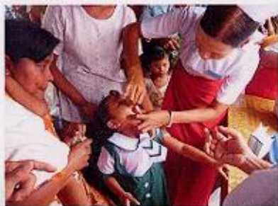
エーヤワディー管区ピアボン 予防接種会場にて

2008年6月、JCVスタッフは、5月にミャンマーを襲ったサイクロン「ナルギス」によって被災された地域の皆さまの生活や予防接種の状況を視察しました。厳しい環境の中でも私たちが贈ったワクチンは、子どもたちに届いていました。