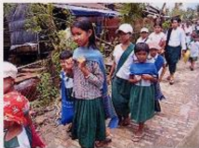
ヤンゴン管区トンテイにて

2008年6月、JCVスタッフは、5月にミャンマーを襲ったサイクロン「ナルギス」によって被災された地域の皆さまの生活や予防接種の状況を視察しました。厳しい環境の中でも私たちが贈ったワクチンは、子どもたちに届いていました。