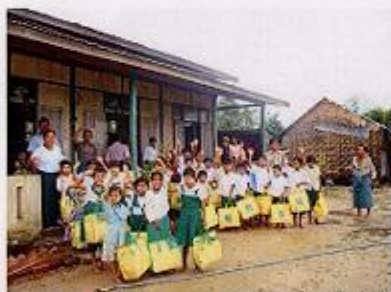
ヤンゴン管区トンテイにて

2008年6月、JCVスタッフは、5月にミャンマーを襲ったサイクロン「ナルギス」によって被災された地域の皆さまの生活や予防接種の状況を視察しました。写真は、子どもがビタミンAを摂取しているところです。