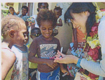
たくさんの方の住人が私たちを出迎えてくれました。

2010年12月、バナアツを視察しました。首都のあるエファテ島から程近い、レレバ島の診療所でのJCV視察ツアーの参加者と現地の子どもたちとの交流のひとこまで。南国の太陽よりもまぶしい、子どもたちの笑顔が印象的でした。