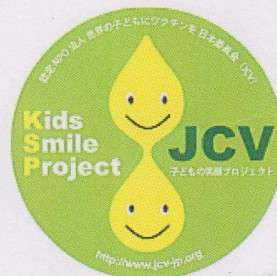
「JCV 子どもの笑顔プロジェクト」

2010年12月、バナアツを視察しました。首都のあるエファテ島から程近い、レレバ島の診療所でのJCV視察ツアーの参加者と現地の子どもたちとの交流のひとこまで。南国の太陽よりもまぶしい、子どもたちの笑顔が印象的でした。